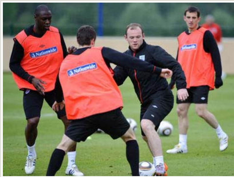
Wayne Rooney stand nicht nur beim Training im Mittelpunkt.

Englands Fußball-Stars bereiten sich im steirischen 9000-Seelenort auf die WM in Südafrika vor und sorgen für viel Erstaunen.